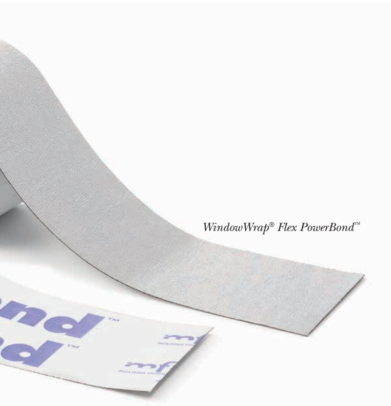
WindowWrap® Flex PowerBond™

Regardless of the application, count on MFM Building Products to deliver the ideal solution when you need a tough, dependable waterproofing barrier to withstand the harshest environments – WindowWrap®.